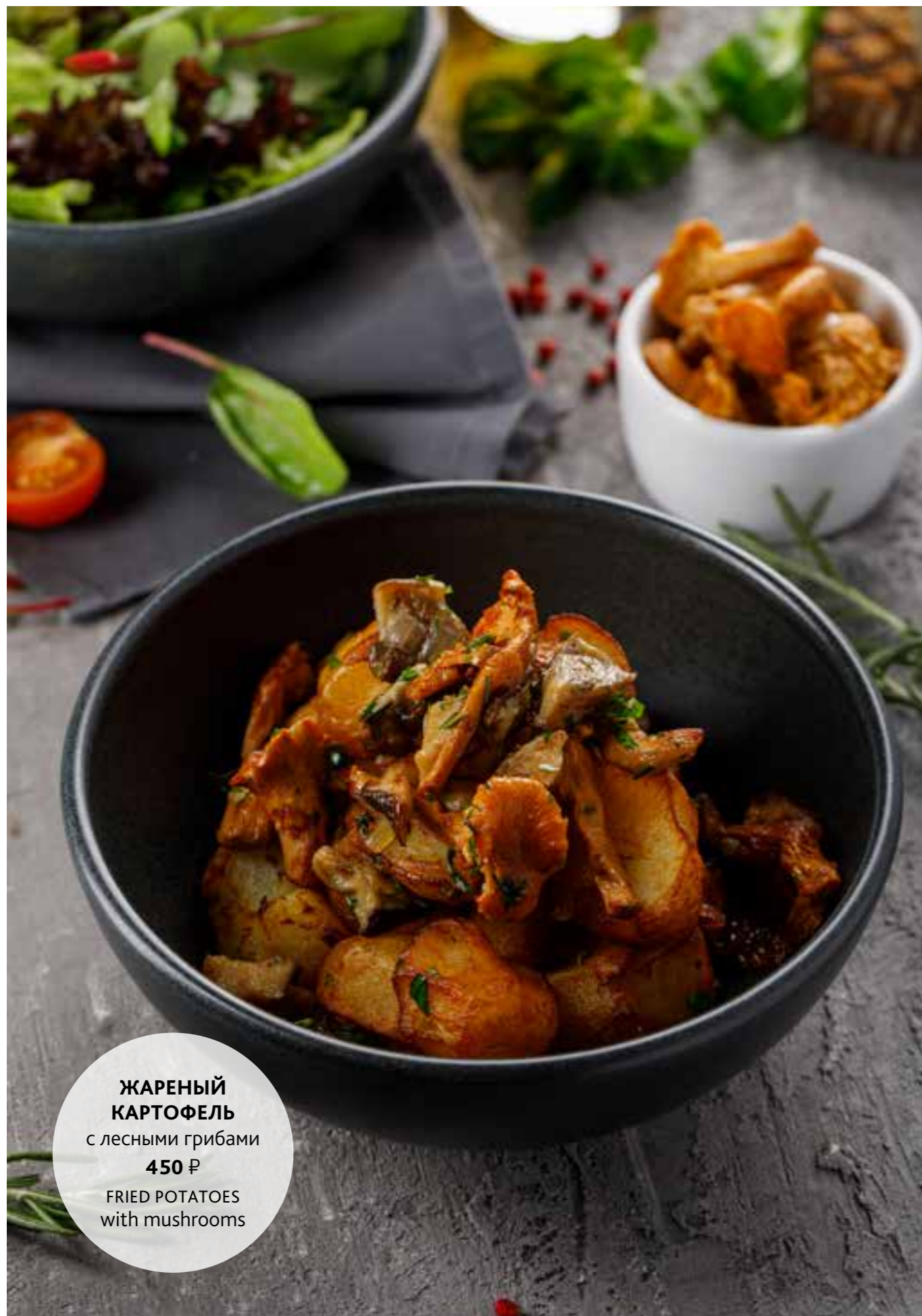
ЖАРЕНый КАРТОФЕЛЬ с лесными грибами 450 ₺ FRIED POTATOES with mushrooms