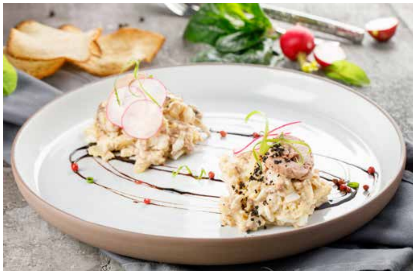
САЛАТ С ПЕЧЕНЬЮ ТРЕСКИ