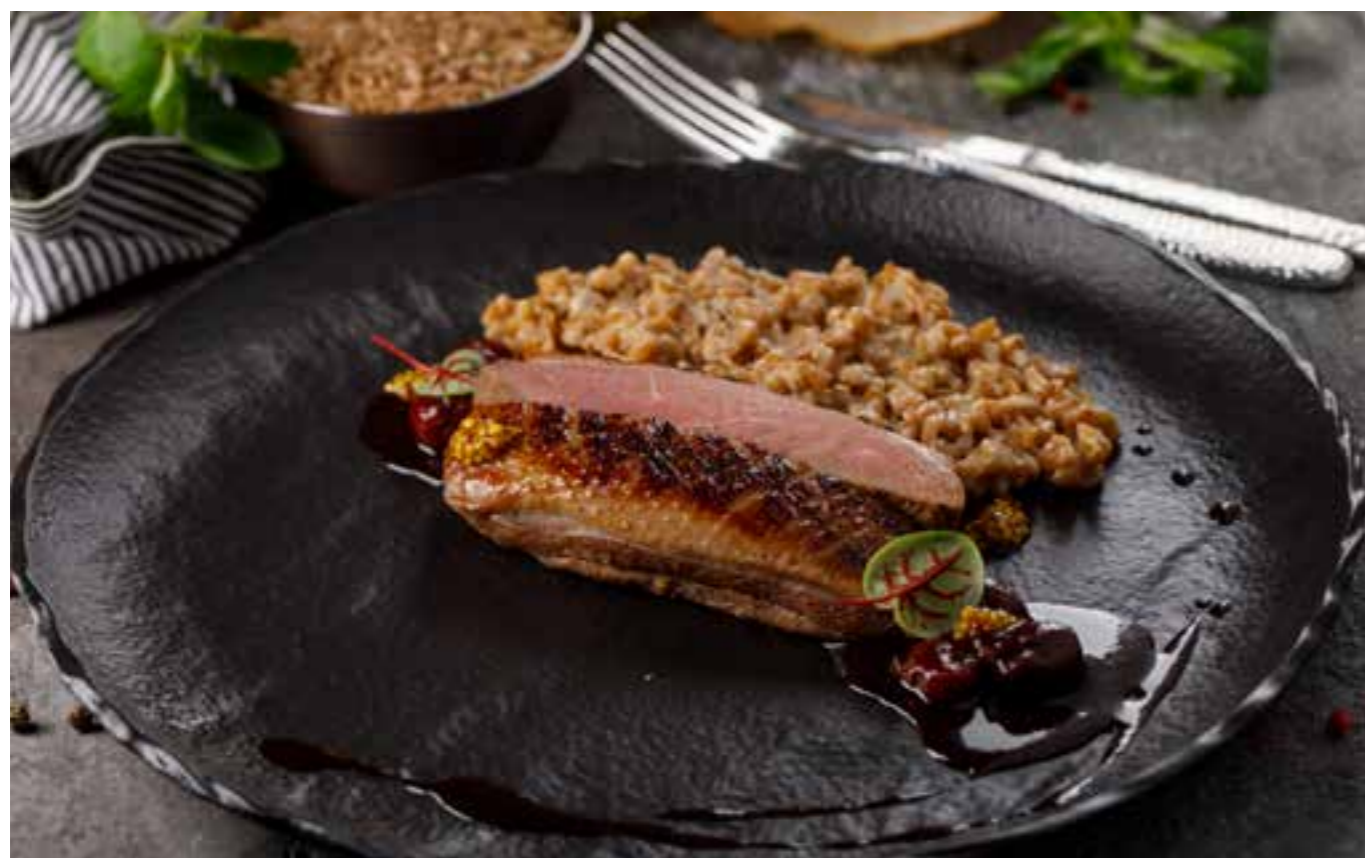
УТИНАЯ ГРУДКА С ПОЛБОЙ И ВИШНЕЙ