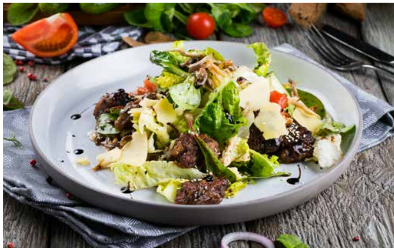
ТЕПЛЫЙ САЛАТ С КУРИНОЙ ПЕЧЕНЬЮ