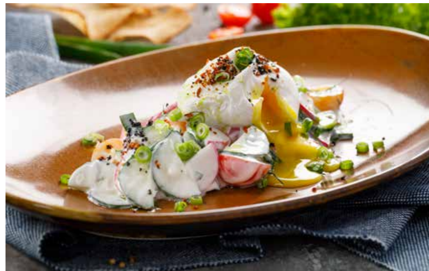
САЛАТ ДЕРЕВЕНСКИЙ С ДОМАШНИМ ЙОГУРТОМ И ЯЙЦОМ ПАШОТ

RUSTIC SALAD WITH HOMEMADE YOGURT AND POACHED EGG