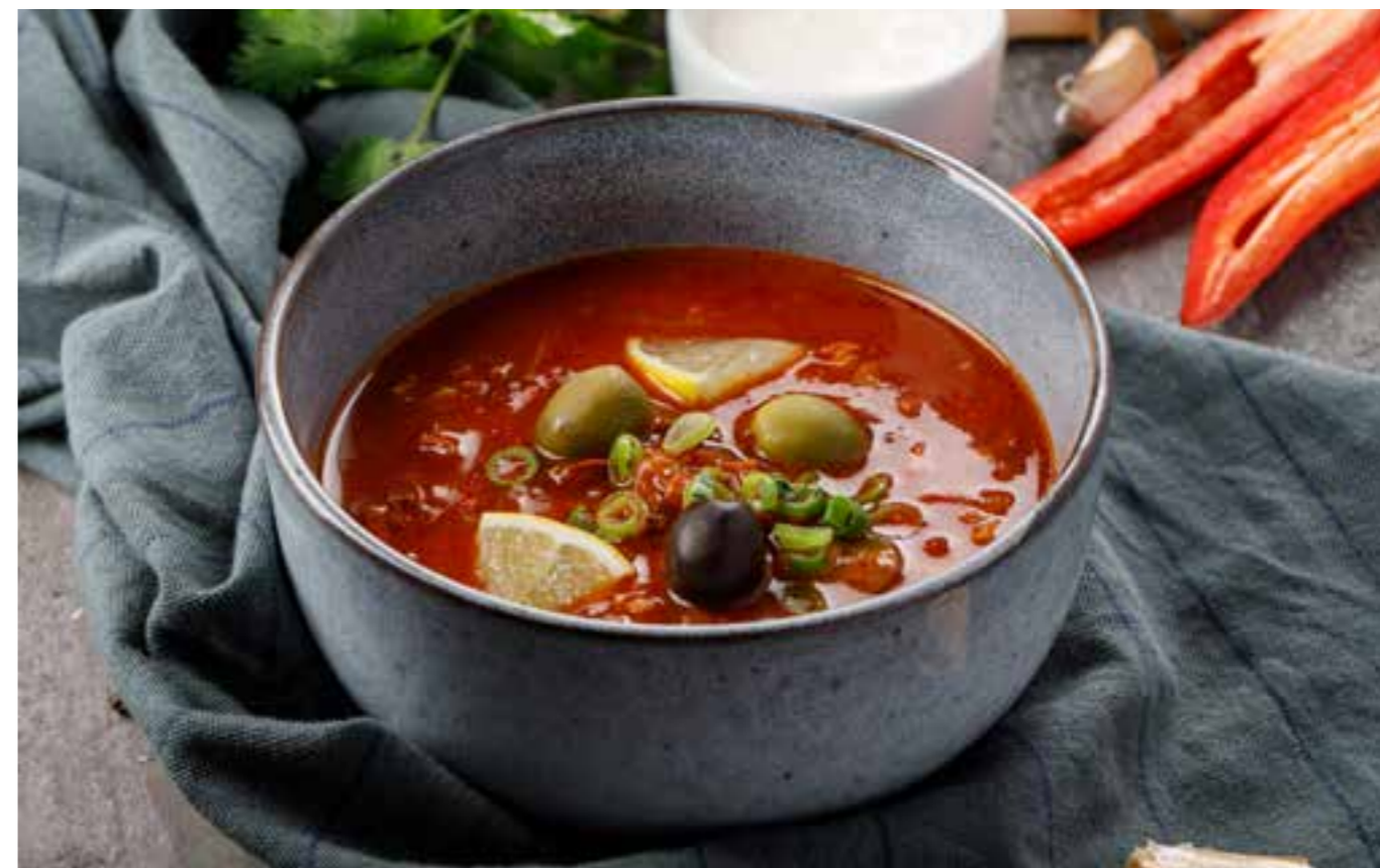
СОЛЯНКА НА БУЛЬОНЕ ИЗ КОПЧЁНОСТЕЙ