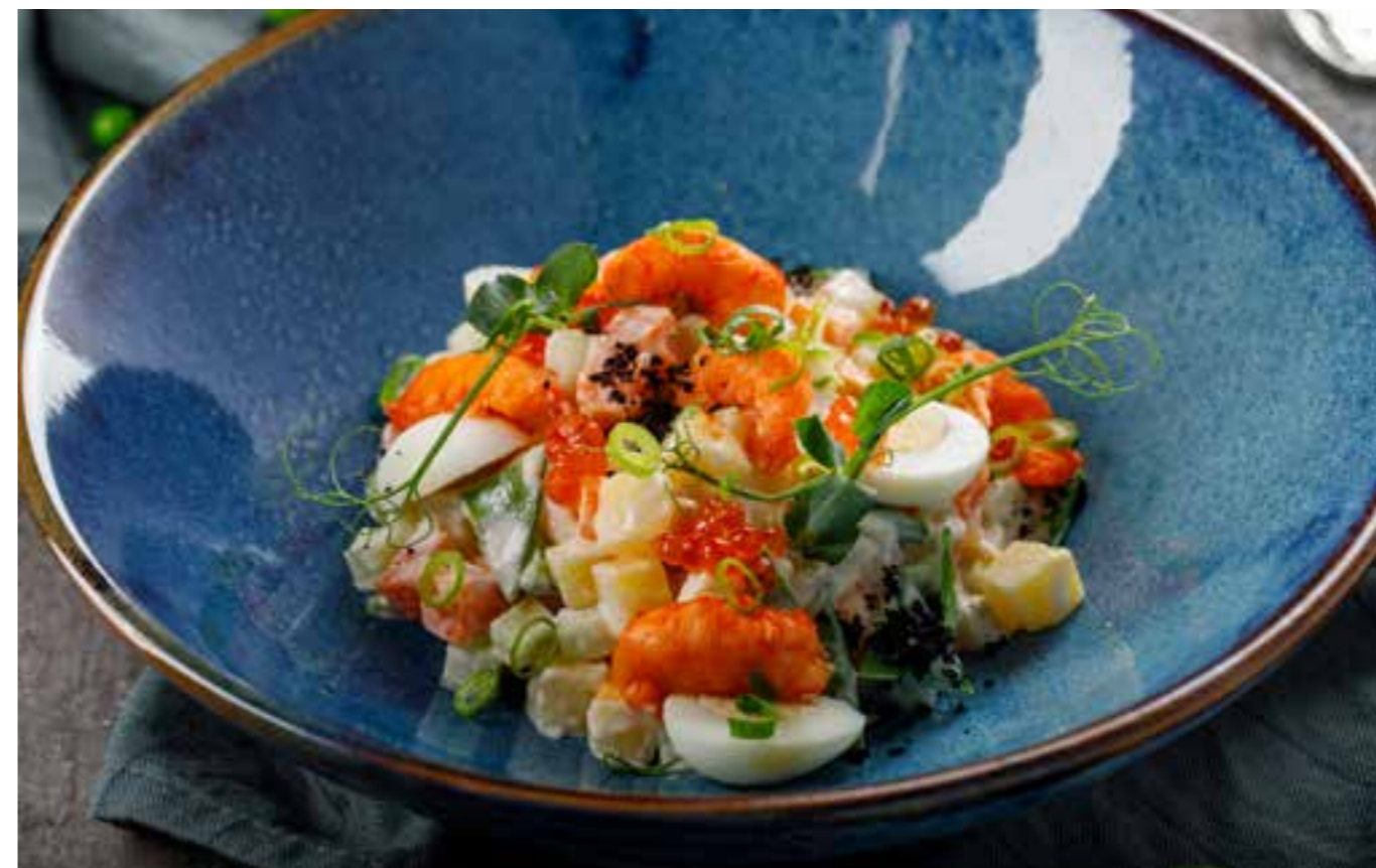
ОЛИВЬЕ С РАКОВЫМИ ШЕЙКАМИ