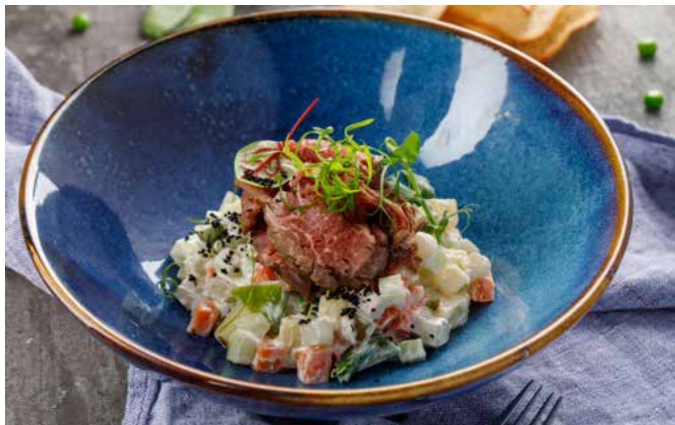
ОЛИВЬЕ С ФЕРМЕРСКОЙ ГОВЯДИНОЙ