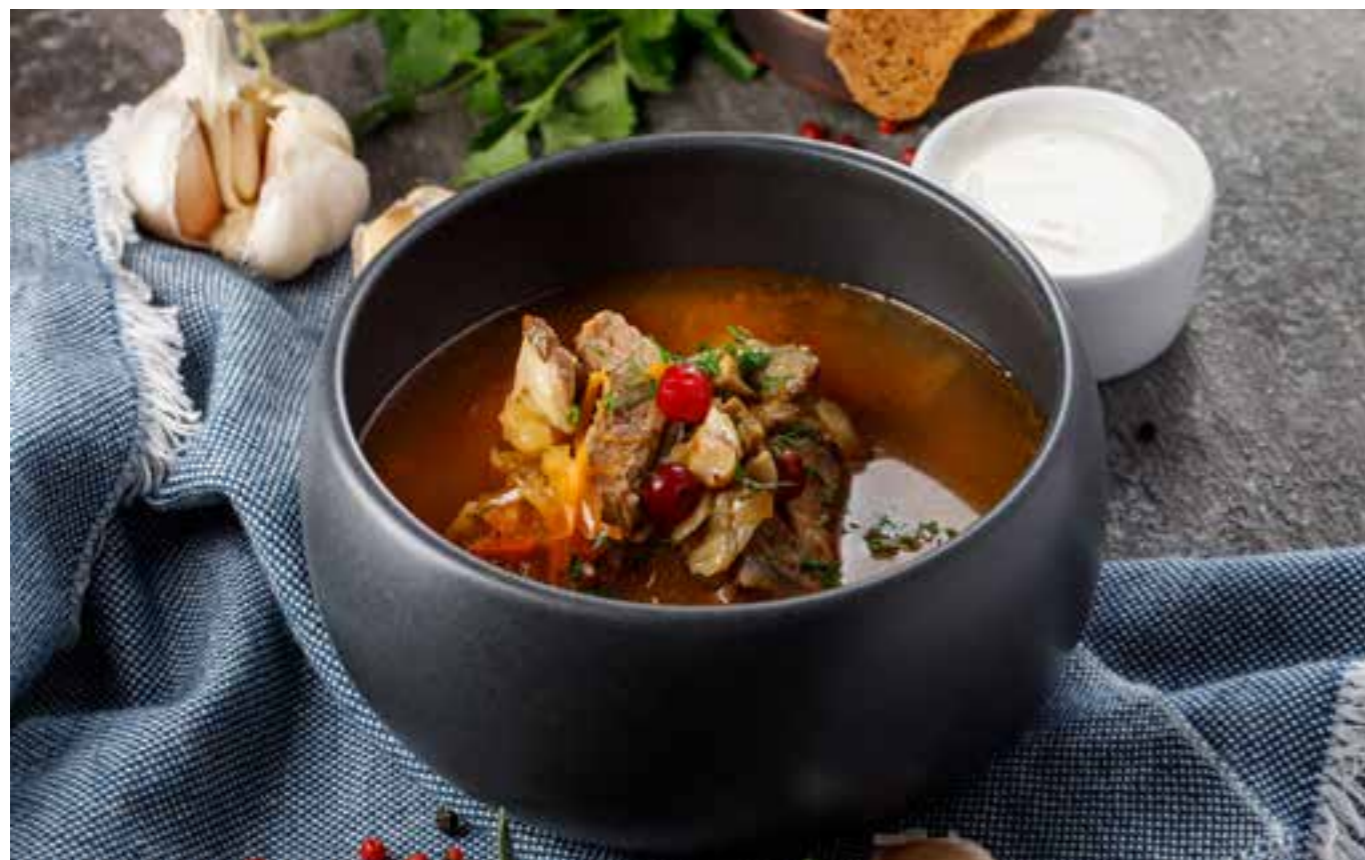
ЩИ КИСЛЫЕ С КЛЮКВОЙ, БЕЛЫМИ ГРИБАМИ И ДЕРЕВЕНСКОЙ СМЕТАНОЙ

RUSSIAN CABBAGE SOUP WITH CRANBERRY AND PORCINI