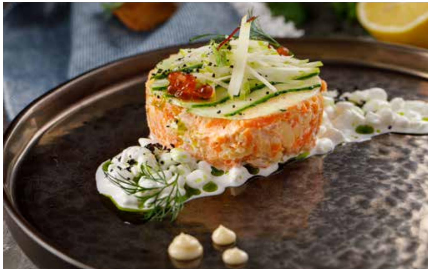
САЛАТ ИЗ ФОРЕЛИ И СИГА Г/К