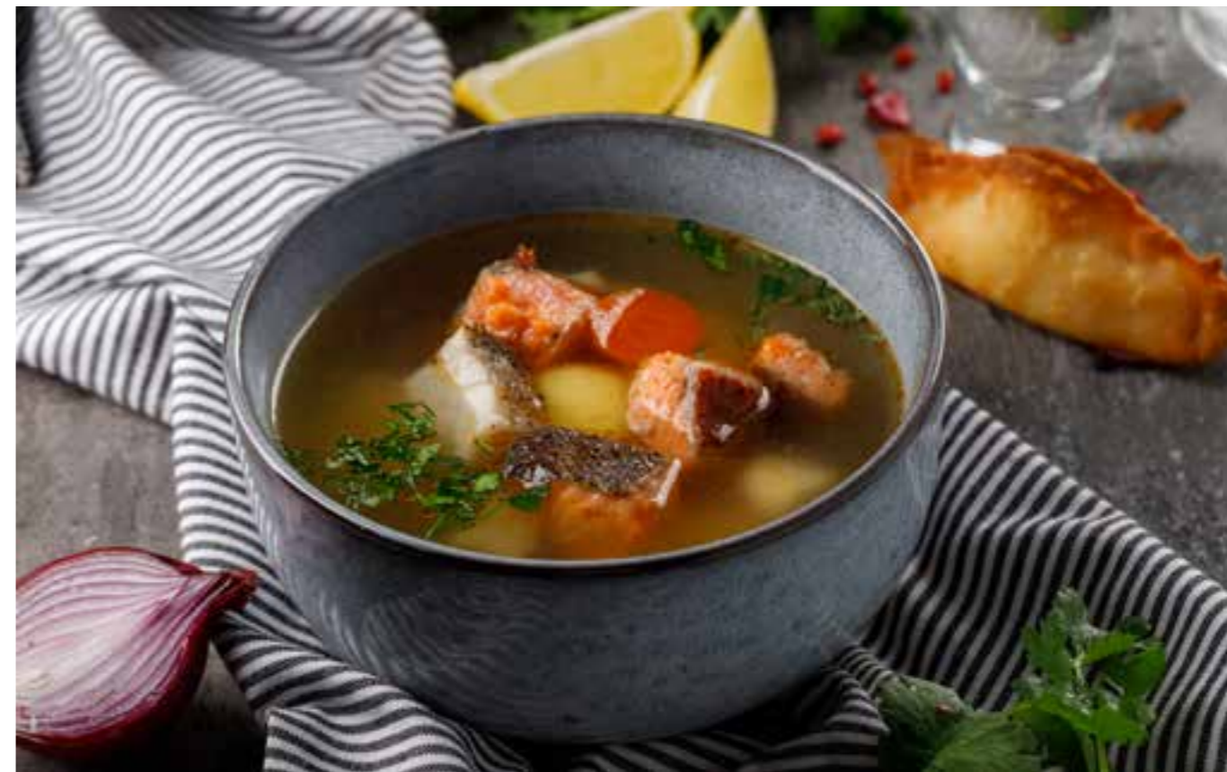
УХА ТРАДИЦИОННАЯ подается с растегаем