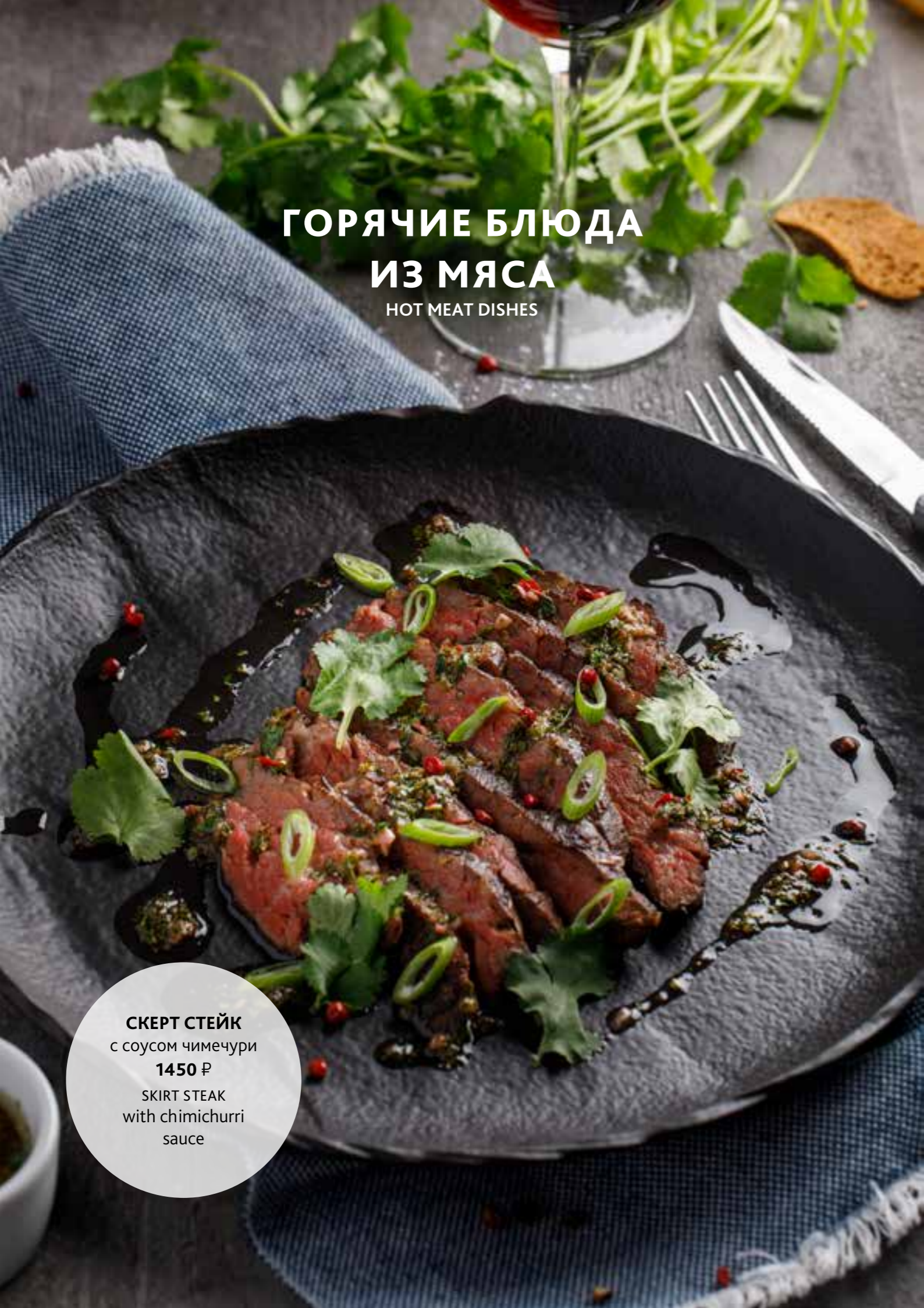
СКЕРТ СТЕЙК с соусом чимечури 1450 ₺ SKIRT STEAK with chimichurri sauce