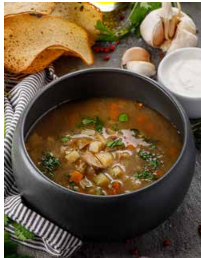
СУП ИЗ БЕЛЫХ ГРИБОВ