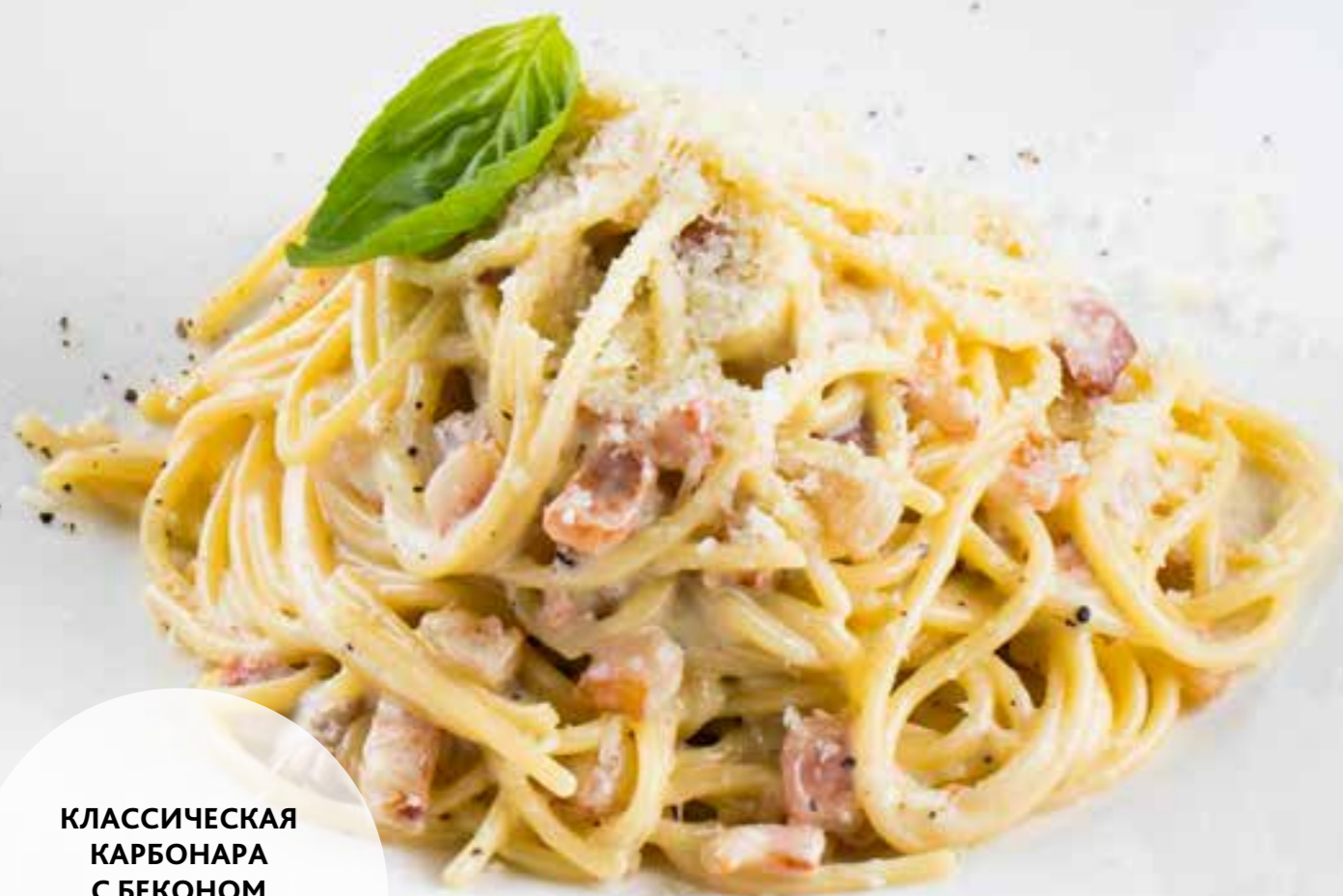
КЛАССИЧЕСКАЯ КАРБОНАРА С БЕКОНОМ 600 ₺ CARBONARA WITH BACON