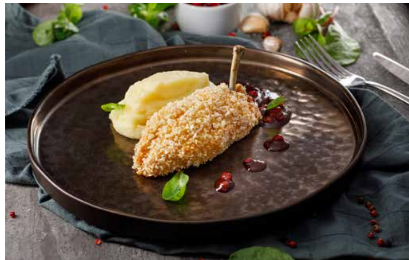
КОТЛЕТА ПО-КИЕВСКИ подаётся с картофельным пюре