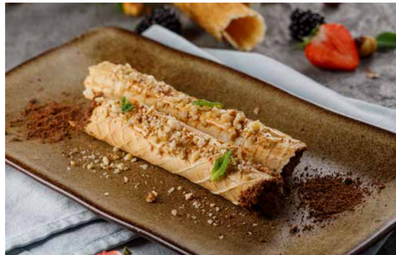
ХРУСТЯЩАЯ ТРУБОЧКА С ВАРЕНОЙ СГУЩЕНКОЙ И ОРЕХАМИ

CRISPY WAFER ROLLS WITH CARAMELIZED MILK AND NUTS