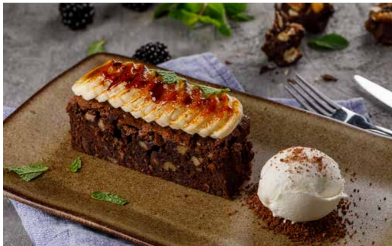
БРАУНИ С КАРАМЕЛИЗИРОВАННЫМ БАНАНОМ И ШАРИКОМ МОРОЖЕНОГО

BROWNIE WITH CARAMELIZED BANANA AND ICE-CREAM