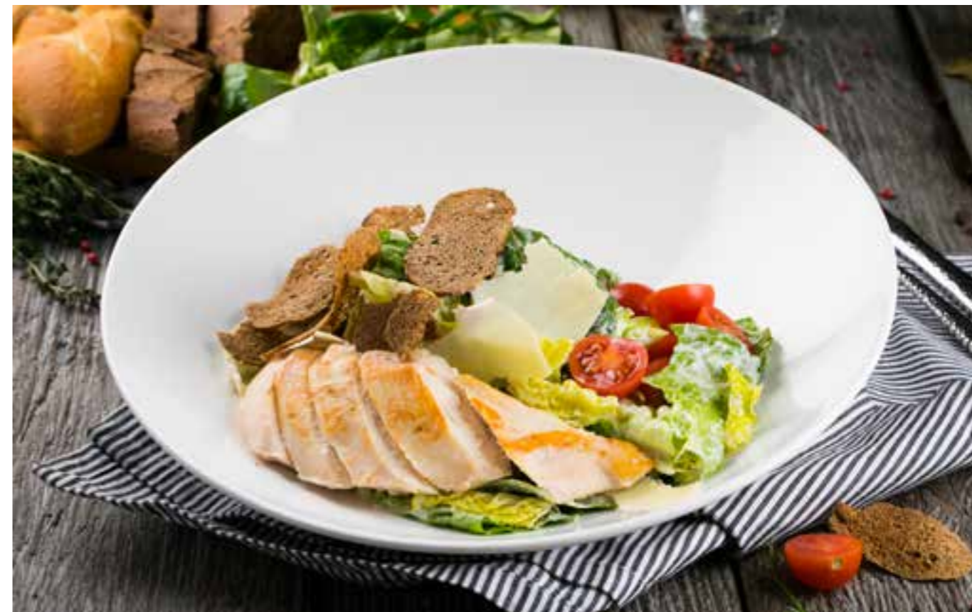
ЦЕЗАРЬ С КУРИНОЙ ГРУДКОЙ