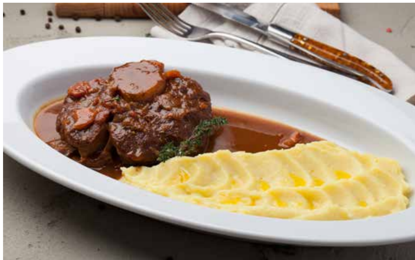
ОССОБУКО С КАРТОФЕЛЬНЫМ ПЮРЕ