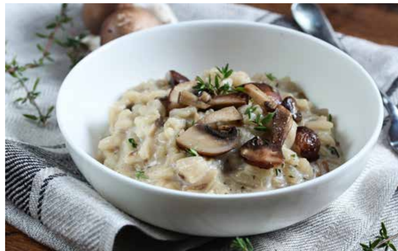
РИЗОТТО С БЕЛЫМИ ГРИБАМИ