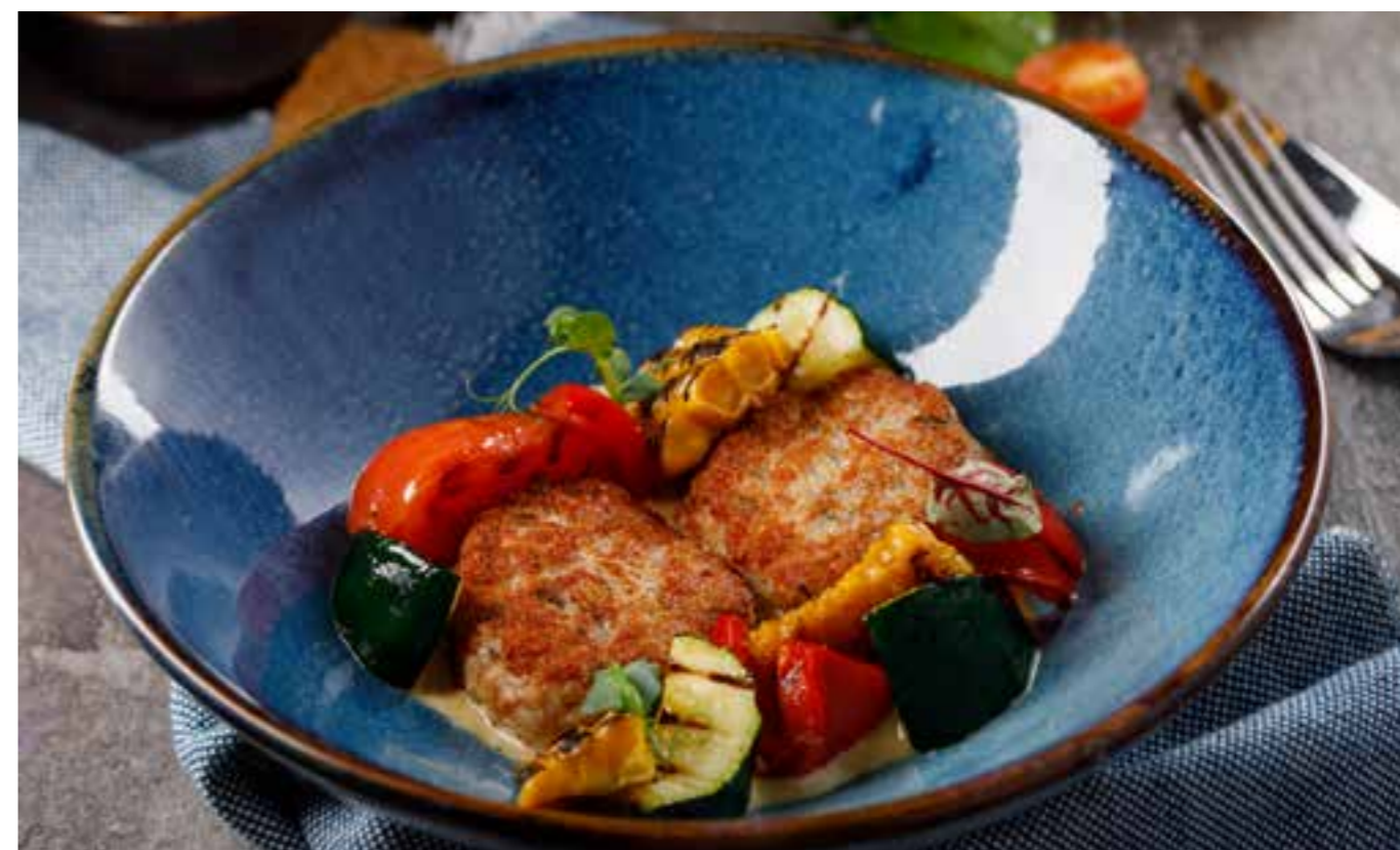
КУРИНАЯ КОТЛЕТА С ОВОЩАМИ НА УГЛЯХ можно приготовить на пару