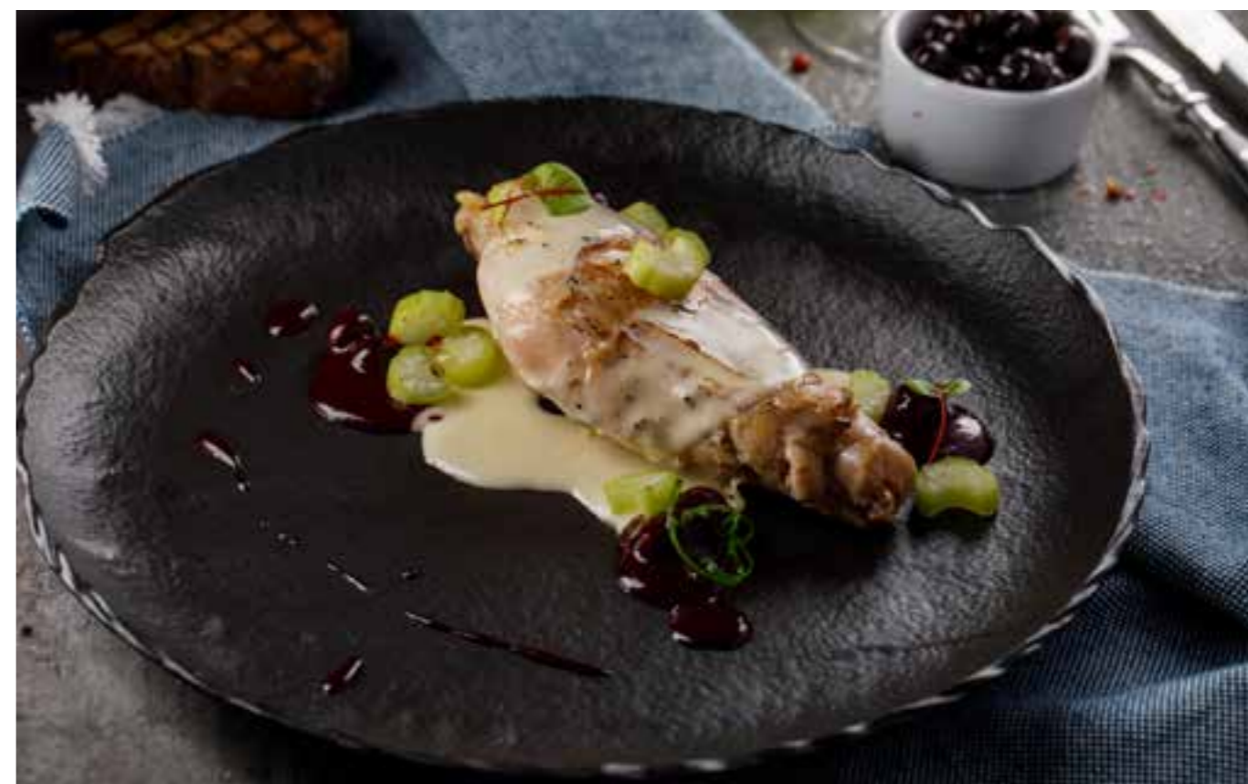
ТОМЛЕНАЯ НОЖКА КРОЛИКА С ЧЕРНОЙ СМОРОДИНОЙ