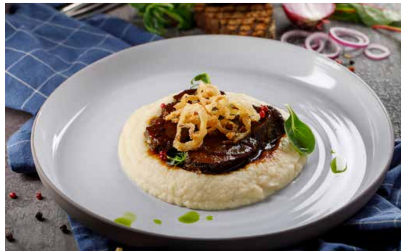
ТЕЛЯЧЬИ ЩЕЧКИ С СЕЛЬДЕРЕЕВЫМ ПЮРЕ